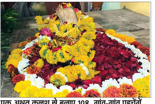
एक अक्षत कलश से बनाए 108, गांव-गांव पहुंचेंगे