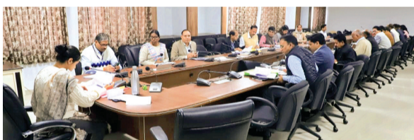
हरिभूमि न्यूज | नलखेड़ा

अपर मुख्य सचिव डॉ.राजेश राजौरा उज्जैन संभाग के आयुक्त, संभाग के समस्त जिला कलेक्टर एवं समस्त जिला पंचायत सीईओ को निर्देश दिये हैं कि उनके द्वारा 31 दिसम्बर को प्रातः 10 से 2 बजे तक उज्जैन संभाग के विकास कार्यों की समीक्षा की जायेगी। जिसमें आगर-मालवा जिले की समीक्षा की जाएगी। समीक्षा लोक निर्माण, नगर निगम, राष्ट्रीय राजमार्ग प्राधिकरण, मप्र सड़क विकास प्राधिकरण, मप्र ग्रामीण सड़क विकास प्राधिकरण, जल संसाधन, नर्मदा घाटी विकास