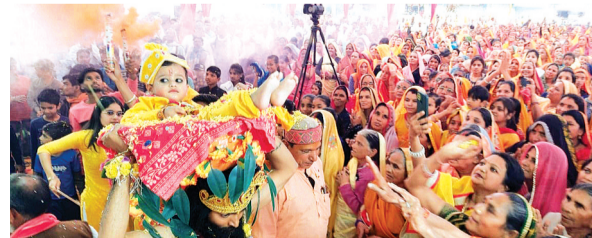
नंद घर आनंद गयो जय कन्हैया लाल की...