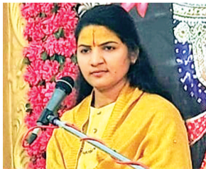
हरिभूमि न्यूज | काणड़